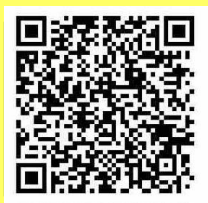
不登校支援の参加申込