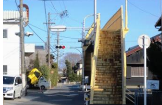
③伊福歩道橋付近 見通しが悪く歩道橋を自転車が使えないため、東西の自転車や車の飛び出しに注意。