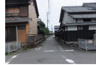
⑨下之森通学路 道が狭く、スピードが出ている車が通ることがあるので飛び出しに特に注意。