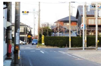
⑥鷹居交差点付近 交差点より北は歩道のないせまい道が多い。右左折する車に注意。