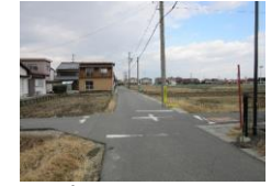
⑩ラッキープラザ名古屋西インター七宝店西住宅地にもかかわらず車のスピードが速く、道が狭い。自転車にも注意。