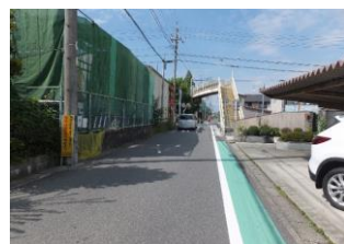
⑦下之森歩道橋付近 南北からの車の出入りや、道路を横切る歩行者、自転車が多い。見通しが悪い。