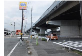
⑩下之森ミニストップの交差点 南北の道路は見通しが悪く、工事車両など車の出入りが多い。