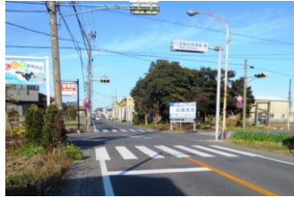
①七宝体育館北交差点付近 抜け道になっており東西の交通量が多い