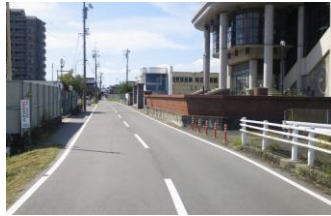
②総合体育館付近 曜日や時間帯によって路上駐車のため、見通しが悪い。子どもの飛び出しに注意。