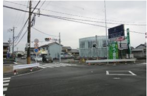
⑦伊福の交差点 バス通りで、とても交通量が多く、朝夕は特に混雑している。交通事故が多発しているので注意。