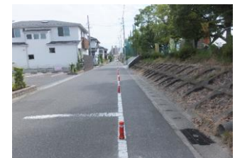
④小学校東の道路 路側部を通路用に仕切っているため道が狭くなっている。校門からの飛び出しに注意。