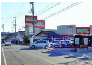
⑧エクボ付近 夕方は交通量が多く、子どももよく通る。カーブで見通しが悪く、歩道も狭い。