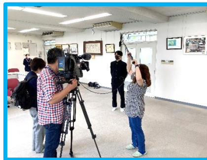
〔 甚目寺中学校の取材の様子 〕