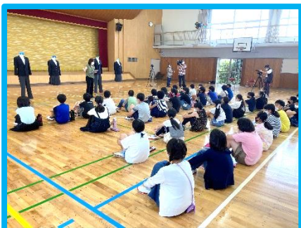
〔 宝小学校の投票の様子 〕