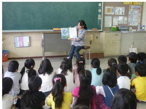
【メルヘンポケット】