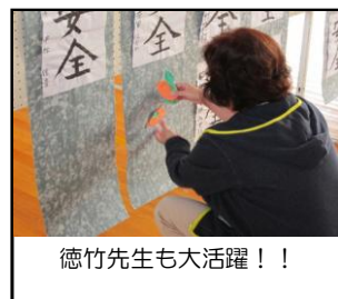
徳竹先生も大活躍!!