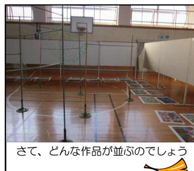
さて、どんな作品が並ぶのでしょうか